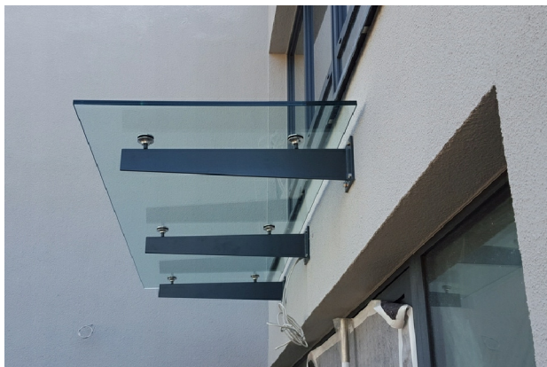
Widok przykładowego zadaszenia

UWAGA! Zadaszenie wykonać z profili wsporczych IPE lub HEB. Przedstawione na rysunku rozwiązanie jest przykładowe. W przypadku wyboru konkretnego producenta należy zachować zbliżoną formę zewnętrzną. Elementy stalowe w kolorze grafitowym RAL 7026. Przykrycie szkłem bezpiecznym. Wsporniki mocować kotwami systemowymi do płyt ściennych betonowych dobranych do konkretnego modelu daszka.